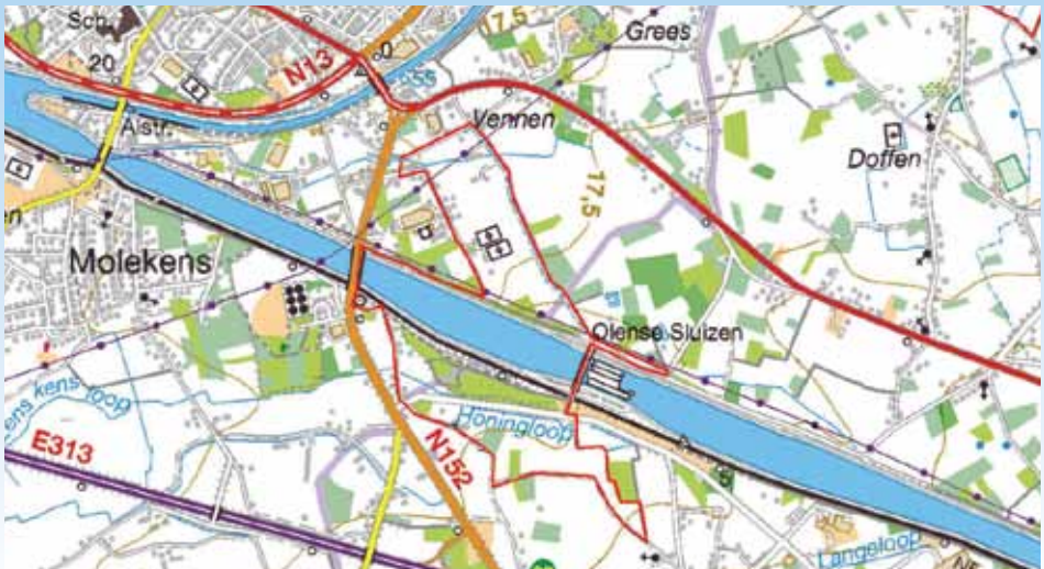
Fragment uit de cd-rom 1: 50 000 "Vlaanderen en Brussel" met toelating A2030 van het Nationaal Geografisch Instituut, tel. 02 629 82 82